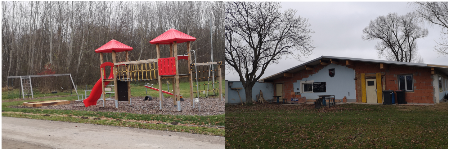
SC Bierbaum / Frauendorf Kinderspielplatz und Zubau Vereinsheim

Die Unterstützung unserer aktiven Vereine wurde auch dieses Jahr trotz oder gerade wegen Corona weiter forciert. Alle fünf Feuerwehren haben einen Pauschalbetrag von je € 2.000,-- zur Abdeckung ihrer laufenden Ausgaben erhalten. Außerdem fördert die Gemeinde engagierte Feuerwehrleute beim Erwerb einer Fahrbeurteilung für LKWs. Der SC Bierbaum / Frauendorf wurde bei der Errichtung eines Kinderspielplatzes und beim Zubau ihres Vereinshauses unterstützt.