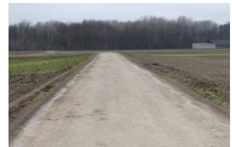
Utzenlaa Hinterer Asphaltweg