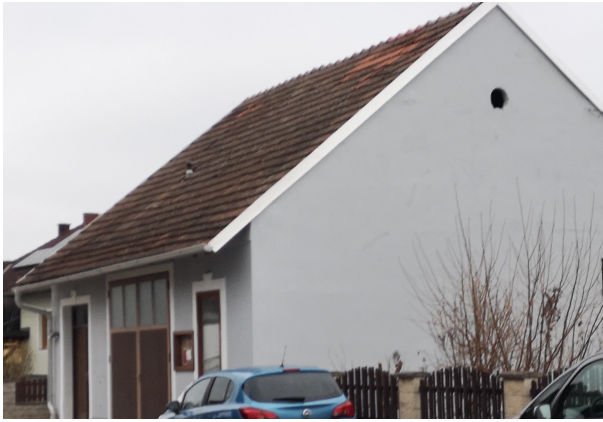
Milchkasino Kapelle außen und innen

Eigentlich wollten wir Utzenlaaer im Jahr 2020 ganz groß "900 Jahr Ersternennung Utzenlaa" feiern. Dazu haben wir in Zusammenarbeit mit der Marktgemeinde Königsbrunn alle öffentlichen Gebäude großteils in Eigenregie renoviert. Begonnen wurde schon im Jahr 2019 mit der Renovierung des Kriegerdenkmals. Beim Milchkasino wurden die beiden desolaten Rauchfänge abgetragen und das Dach rundherum mit Schutzblechen abgesichert. Die Fassade von der FF-Utzenlaa ausgebessert und mit einem neuen Anstrich versehen. Ebenfalls neu gestrichen wurden das Waaghüttl, das Hüttl beim Waschplatz sowie das Buswartehäuschen. Die meiste Arbeit wurde in die Renovierung der Kapelle gesteckt. Schon im Herbst 2019 wurde der feuchte Außen- und Innenputz abgeschlagen. Im Frühjahr 2020 haben die Bauhofmitarbeiter dann einen neuen Putz angebracht. Von den Utzenlaaern selbst wurde die Türe abgeschliffen und gestrichen, die Fenster neu eingeglast und gestrichen sowie die Holztäfelung, worauf die Bänke montiert sind und der Fliesenboden neu eingelassen. Nun ist der ganze Ort für ein Jubiläumsfest gerüstet.